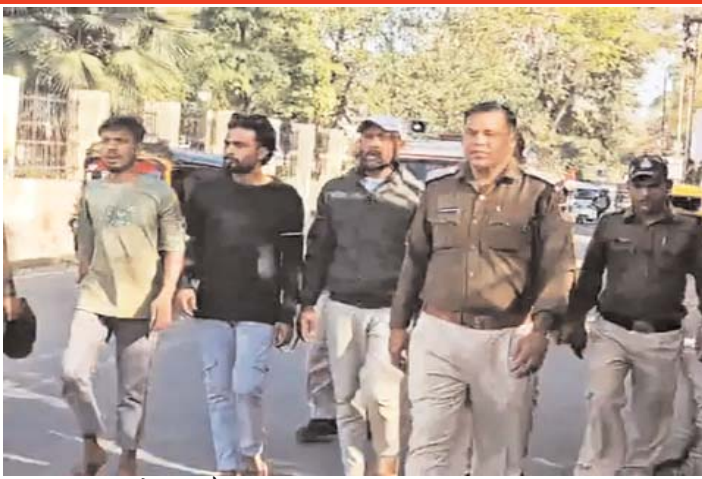
इलेक्ट्रॉनिक ऑटो से मौके पर आए। उन्होंने पुरानी रजिस्ट्रेशन के चलते गालीगलौज शुरू कर दी। गाली देने से मना किया तो