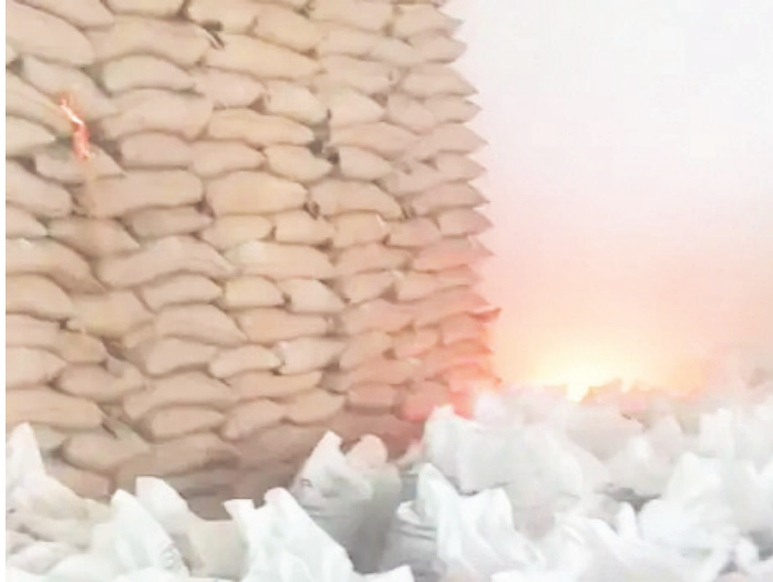
लपटें उठ रही थीं। हालांकि शटर लॉक नहीं थे।

मीडिया ऑडिटर, खंडवा (निप्र)। खंडवा के छैगांवमाखन क्षेत्र में एक गेहूं खरीदी केंद्र पर आगजनी का मामला सामने आया है। आग की चपेट में आने से गेहूं की दर्जनों बोřियां जल गईं। किसानों ने धुआं उठता और आग की लपटें देखीं, जिसके बाद केंद्र पर मौजूद कर्मचारियों को जानकारी दी। इसके बाद टैंकर से पानी लाकर आग बुझाई गई। मौके पर फायर ब्रिगेड भी पहुंची, लेकिन तब तक आग पर काबू पा लिया गया था।