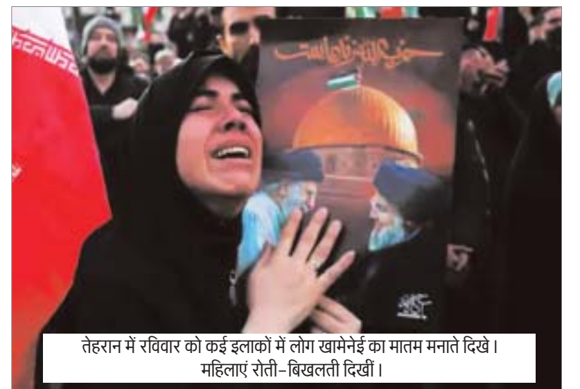
तेहरान में रविवार को कई इलाकों में लोग खामेनेई का मातम मनाते दिखे। महिलाएं रोती-बिखलती दिखीं।

ईरान में मातम - अमेरिका में जश्न: अमेरिका-इजराइल ने ईरान पर 24 घंटे में 1200 बम गिराए