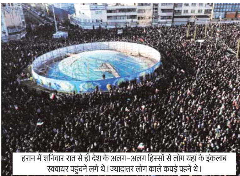
हरान में शनिवार रात से ही देश के अलग-अलग हिस्सों से लोग यहां के इकलाब स्क्वायर पहुंचने लगे थे। ज्यादातर लोग काले कपड़े पहने थे।