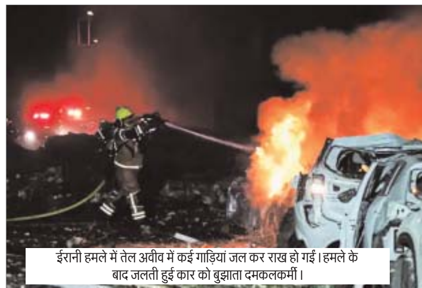
ईरानी हमले में तेल अवीव में कई गाड़ियां जल कर राख हो गईं। हमले के बाद जलती हुई कार को बुझाता दमकलकर्मी।