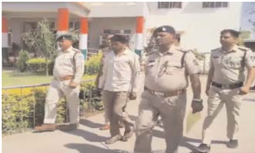
मीडिया ऑडिटर, शिवपुरी (निप्र)। जिले के खनियाधाना थाना क्षेत्र के ग्राम देवरी में एक

14 वर्षीय नाबालिग लड़की के साथ दुष्कर्म का मामला सामने आया है। कुछ दिन पहले रात में