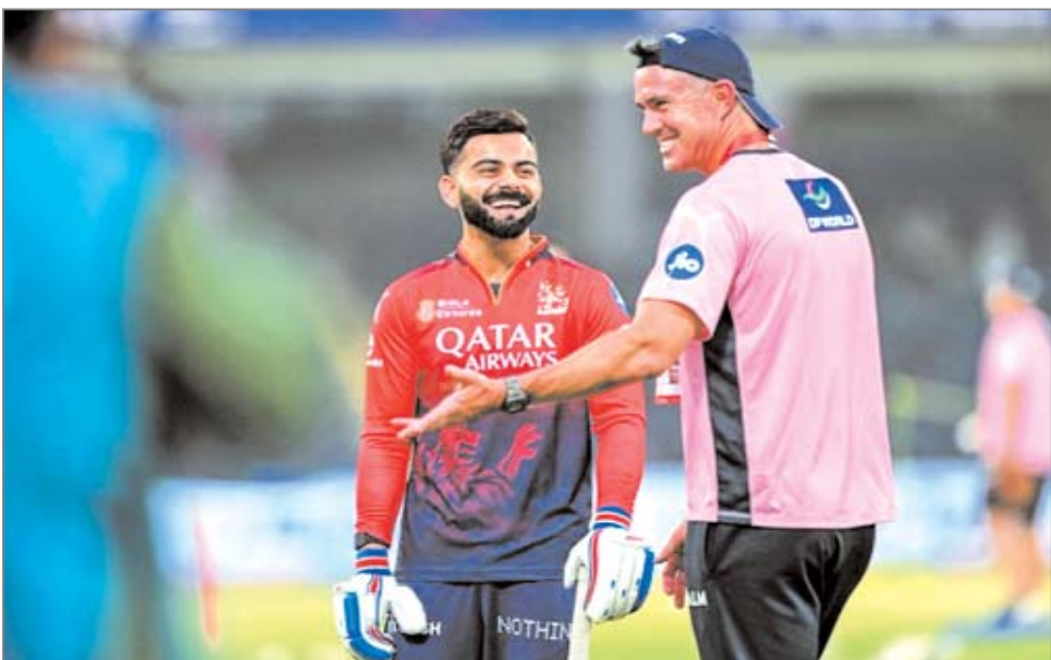
सभी को देखने के लिए बेताब हूँ।' केविन पीटरसन ने अपने अंतरराष्ट्रीय करियर में 104 टेस्ट मैच खेले,