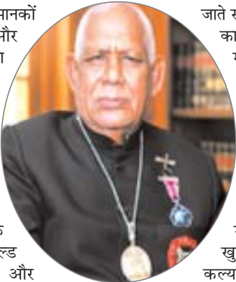
24 मई 1999 को हरिद्वार जाते समय मेरठ के पास एक कार दुर्घटना में उनकी मृत्यु हो गई। उन्हें 1987 में प्रतिष्ठित द्रोणाचार्य पुरस्कार और 1983 में पद्म श्री से सम्मानित किया गया था। 9 अगस्त 2003 को, दिल्ली के पूर्व मुख्यमंत्री मदन लाल खुराना ने नई दिल्ली के कल्याण विहार स्पोर्ट्स स्टेडियम में गुरु हनुमान की एक मूर्ति का अनावरण किया। भारतीय उद्योगपति के.के. बिड़ला ने उन्हें मलकागंज, सब्जी मंडी (पुरानी दिल्ली) में अखाड़ा खोलने के लिए जमीन दी, इस तरह 1925 के आसपास बिड़ला