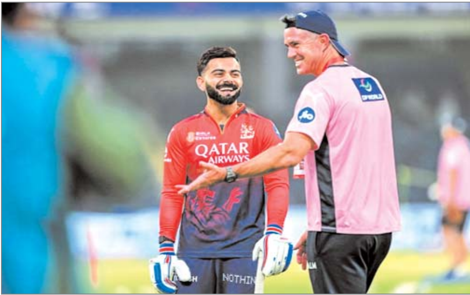
सभी को देखने के लिए बेताब हूँ।' केविन पीटरसन ने अपने अंतरराष्ट्रीय करियर में 104 टेस्ट मैच खेले,

नई दिल्ली। इंडियन प्रीमियर लीग (आईपीएल) के 19वें सीजन की शुरुआत 28 मार्च से होगी, जिससे पहले इंग्लैंड के पूर्व क्रिकेटर केविन पीटरसन ने दिल्ली कैपिटल्स (डीसी) फ्रेंचाइजी के मेंटॉर पद से इस्तीफा दे दिया है। 45 वर्षीय पीटरसन का कहना है कि वह इस भूमिका के लिए जरूरी समय नहीं दे पाएंगे हालांकि, इस टूर्नामेंट में कमेंट्री बॉक्स में वापसी करेंगे दिल्ली कैपिटल्स ने पिछले साल फरवरी में पीटरसन को आईपीएल 2025 में इस भूमिका के लिए नियुक्त किया था इस बीच पीटरसन ने सपोर्ट स्टाफ के साथ मिलकर काम किया, जिसमें क्रिकेट निदेशक वेणुगोपाल राव, हेड कोच हेमांग बदानी, असिस्टेंट कोच मैथ्यू मॉट और गेंदबाजी कोच मुनाफ पटेल शामिल थे इंग्लैंड के इस दिग्गज खिलाड़ी ने सोशल मीडिया प्लेटफॉर्म 'एक्स' पर यह जानकारी साझा करते हुए कहा, 'मैं इस आईपीएल सीजन में दिल्ली कैपिटल्स का मेंटॉर नहीं रह पाऊंगा मैं इस काम के लिए जरूरी समय नहीं दे सकता। इस सीजन के लिए सभी खिलाड़ियों को मेरी शुभकामनाएं हालांकि, मैं कमेंट्री बॉक्स में आप सभी से फिर मिलूंगा आईपीएल दुनिया की सबसे बेहतरीन लीग है मैं जल्द ही आप