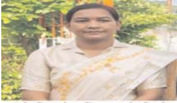
यूपी अतिरिक्त न्यायाधीश, जिला आचरणीय अधिकारी

मीडिया ऑडिटर, एमसीबी (निप्र) । समाज में महिलाओं की भूमिका लगातार बदल रही है। आज महिलाएं केवल घर की जिम्मेदारियों तक सीमित नहीं हैं, बल्कि प्रशासन, राजनीति, शिक्षा और विकास के हर क्षेत्र में अपनी मजबूत उपस्थिति दर्ज करा रही हैं। नवीन जिला मनेंद्रगढ़-चिरमिरी-भरतपुर (एमसीबी) इस परिवर्तन का एक प्रेरणादायक उदाहरण बनकर सामने आया है, जहाँ नारी शक्ति प्रशासनिक नेतृत्व में महत्वपूर्ण भूमिका निभा रही है जिले में वर्तमान में 16 महिला प्रशासनिक अधिकारी और 6 निर्वाचित महिला जनप्रतिनिधि शीर्ष पदों पर कार्यरत हैं। ये महिलाएं अपने कर्तव्यों का निर्वहन पूरी निष्ठा, मेहनत और जिम्मेदारी के साथ करते हुए जिले के प्रशासनिक और विकासगत कार्यों को आगे बढ़ा रही हैं। यह स्थिति न केवल महिलाओं की बढ़ती भागीदारी को दर्शाती है, बल्कि समाज में उनके प्रति बदलती सोच का भी प्रतीक है।