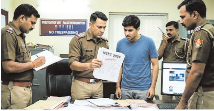
छात्रों को परीक्षा से दो दिन

जयपुर, एजेंसी। राष्ट्रीय पात्रता सह प्रवेश परीक्षा (नीट)-2026 की तैयारी में केंद्र परीक्षा रद्द की गई है। राजस्थान के सीकर और झुंझुनूं में परीक्षा से दो दिन पहले कई छात्रों को गैस पेपर मिला था। दावा किया जा रहा है कि गैस पेपर के सवाल परीक्षा में आए पेपर के सवालों से मिलते हुए थे। इस मामले में राजस्थान एसओजी (स्पेशल ऑपरेशन ग्रुप) ने मुखबिर से मिली सूचना के आधार पर आठ मई से जांच शुरू की है। एसओजी की दो टीमों ने सीकर और झुंझुनूं में पहुंचकर जांच कर कई तथ्य जुटाने के साथ ही कुछ लोगों से पूछताछ भी की थी। इस मामले में अब तक 15 लोगों को पकड़ा है। जानकारी के अनुसार नीट परीक्षा के सात सौ अंकों में से छह सौ अंकों के सवाल सीकर एवं झुंझुनूं के