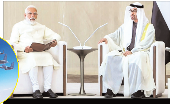
मोदी बोले- भारत-यूई साझेदारी नई ऊंचाइयों पर पहुंची

क्रूड ऑयल का उत्पादन बढ़ाएगा यूई : यूई ने हाल ही