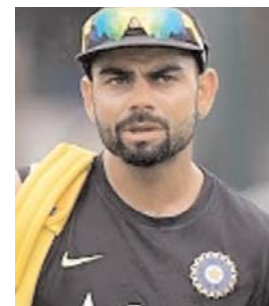
विराट कोहली को...