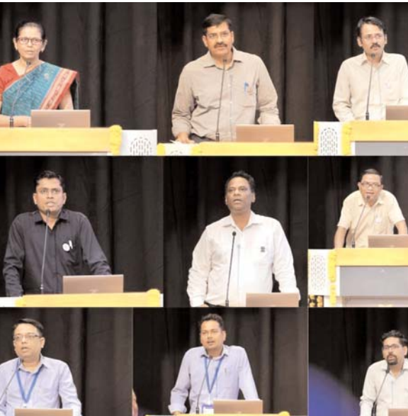
ग्लोबल स्किल पार्क ने हाल ही में आईआईटी दिल्ली, आईआईटी रोपड़ और राष्ट्रीय रक्षा विश्वविद्यालय जैसे प्रतिष्ठित संस्थानों से साझेदारी कर, कौशल विकास को अनुसंधान और अत्याधुनिक तकनीकों से जोड़ने की दिशा में नवाचारी कदम बढ़ाया है। आगामी

मीडिया ऑडिटर, भोपाल (एजेंसी)। संत शिरोमणि रविदास ग्लोबल स्किल पार्क में सत्र 2025-26 का शुभारंभ विशेषज्ञों द्वारा दिए गए ओरिएंटेशन के साथ हुआ। इस सत्र में देश के विभिन्न राज्यों से आए 350 से अधिक युवा छात्र-छात्राओं ने सहभागिता की। यह आयोजन महज एक औपचारिक सत्र न होकर, युवाओं के जीवन में आत्मबल, तकनीकी दक्षता और नवाचार की दिशा में प्रथम निर्णायक कदम बनेगा। मध्यप्रदेश उत्तर प्रदेश, बिहार, झारखंड, हरियाणा, आंध्र प्रदेश, छत्तीसगढ़, राजस्थान और महाराष्ट्र जैसे राज्यों से आए विद्यार्थियों ने ग्लोबल स्किल पार्क को गुणवत्ता आधारित करियर निर्माण का केंद्र मानते हुए प्रवेश लिया है। कार्यक्रम में छात्रों को संस्थान की उन्नत अधोसंरचना, इंडस्ट्री इंटीग्रेटेड पाठ्यक्रमों, आधुनिक प्रयोगशालाओं और भविष्य की आवश्यकताओं के अनुरूप कौशल विकास की संपूर्ण प्रक्रिया से परिचित कराया गया। ग्लोबल स्किल पार्क की शिक्षण व्यवस्था विद्यार्थियों को केवल जांब ओरिएंटेट नहीं, बल्कि समस्या समाधानकर्ता और नवाचार आधारित उद्यमशील नागरिक के रूप में तैयार करने पर केंद्रित है। विशेषज्ञों द्वारा आयोजित सत्र में विद्यार्थियों को बताया गया कि यहाँ दी जाने वाली शिक्षा ट्रेनिंग फॉर एम्प्लॉयमेंट टू ट्रेनिंग फॉर एम्प्लॉयमेंट की सोच पर आधारित है। छात्रों को प्रोफेशनल एटिकेट, संचार कौशल, नेतृत्व क्षमता और डिजिटलीकरण के साथ जांब रेडी स्किल्स का प्रशिक्षण भी दिया जाएगा। यह दृष्टिकोण ग्लोबल स्किल पार्क को पारंपरिक आईटीआई और पॉलिटेक्निक मॉडल से अलग करता है।