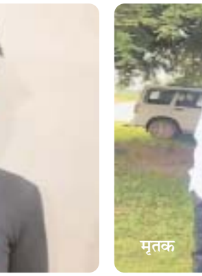
वो बुरी तरह घायल होकर जमीन पर गिर गया। उसके शरीर से तेजी से खून बहने लगा। इस दौरान आरोपी