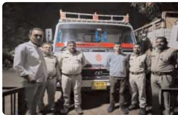
निकले। टीम ने पीछा कर तीन वाहनों को पकड़ा: वन विभाग की दूसरी टीम ने भठिया में वाहनों को रोकने

वन परिक्षेत्राधिकारी जैतपुर की टीम गश्त कर रही थी। इसी दौरान खासरीडोल की तरफ से कई पिकअप वाहन आते दिखे। टीम ने वाहनों को रोकने की कोशिश की। लेकिन एक वाहन चालक ने रेंजर की गाड़ी को टक्कर मार दी और सभी वाहन भाग