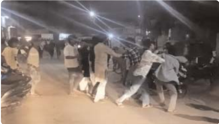
ट्रैफिक होता रहा जाम, मोहल्लेवासियों में नाराजगी: यह

जानकारी के मुताबिक, टिकरापारा इलाके में कविता नगर और ब्रिज नगर है। इन दोनों मोहल्लों के अलग-अलग गैंग के 12 से अधिक लड़कों के बीच मंगलवार देर शाम मारपीट हो गई। मोहल्लेवासियों ने टिकरापारा थाने में लिखित शिकायत दी, लेकिन पुलिस ने एफआईआर दर्ज नहीं की है।