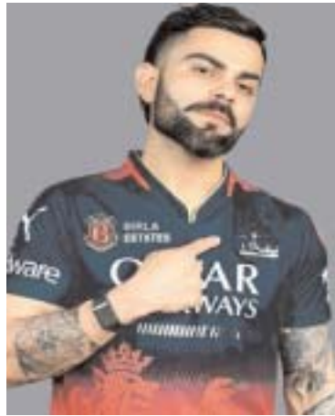
खतरनाक गेंदबाजों में शुमार हैं और विराट कोहली ने भी उन्हीं का नाम लिया,

नई दिल्ली (एजेंसी)। विराट कोहली दुनिया के बेहतरीन बल्लेबाजों में से एक हैं। उनके सामने बड़े-बड़े गेंदबाज फीके पड़ जाते हैं लेकिन आईपीएल शुरू होने से पहले उन्होंने खुलासा करते हुए बताया कि उन्हें कौन सा गेंदबाज अभी तक सबसे मुश्किल लगा है। जिसके सामने उन्हें रन बनाने में कठिनाई होती है। आरसीबी के पूर्व कप्तान विराट कोहली अभी आईपीएल में सबसे ज्यादा रन बनाने वाले बल्लेबाज हैं। उनके नाम 8004 रन हैं। बुमराह की बात करें तो उन्होंने अपने आईपीएल की पहली विकेट विराट कोहली की ही ली थी। कोहली समेत इस मैच में उन्होंने 3 विकेट चटकए थे। बुमराह अभी सबसे