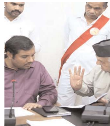
आवेदकों की समस्याओं पर संबंधित क्षेत्र के अधिकारियों को कार्यवाही करने के निर्देश दिए।