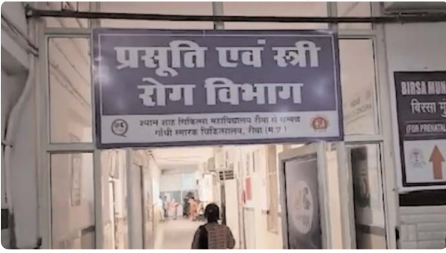
महिलाओं की हालत में सुधार नहीं होने से परिजन भी परेशान हैं।

मीडिया ऑडिटर, रीवा (निप्र)। गांधी स्मृति चिकित्सालय के गायनी विभाग में प्रचलित के बाद महिलाओं ने अपनी याददाश्त खो दी है, वे अपने परिवार के सदस्यों तक को नहीं पहचान पा रही हैं। इस मामले से चिकित्सक भी हैरान हैं। घटना से अस्पताल में हड़कंप मचा हुआ है। महिलाओं का चिकित्सकों की देखरेख में गहन चिकित्सा इकाई में उपचार चल रहा है, वहीं