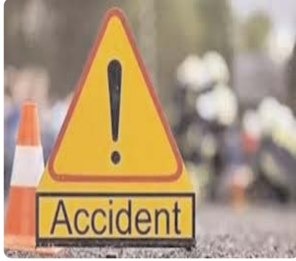
फरार बाइक चालक की तलाश कर रही है। थाना प्रभारी ने