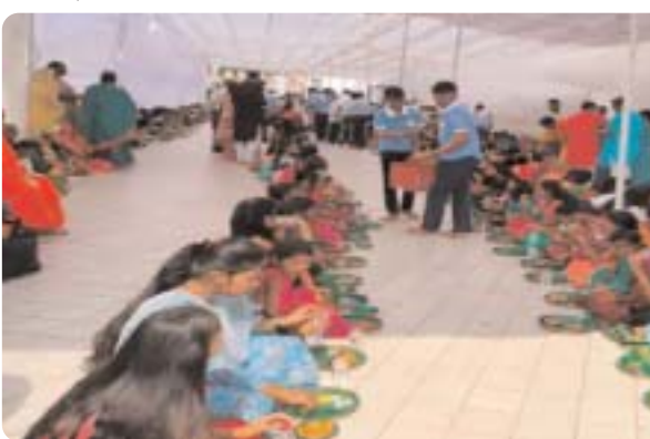
प्रशासनिक अधिकारियों और जनप्रतिनिधियों ने स्वयं कन्याओं को

मीडिया ऑडिटर, अनूपपुर (निप्र)। अनूपपुर के अमरकंटक में नर्मदा जयंती का पर्व मंगलवार को मनाया गया। मां नर्मदा के दर्शन के लिए लाखों श्रद्धालु परंपरागत वेश-भूषा में नर्मदा मंदिर पहुंचे। जहां 'हर हर नर्मदे' के जयघोष से पूरा वातावरण भक्तिमय हो गया।