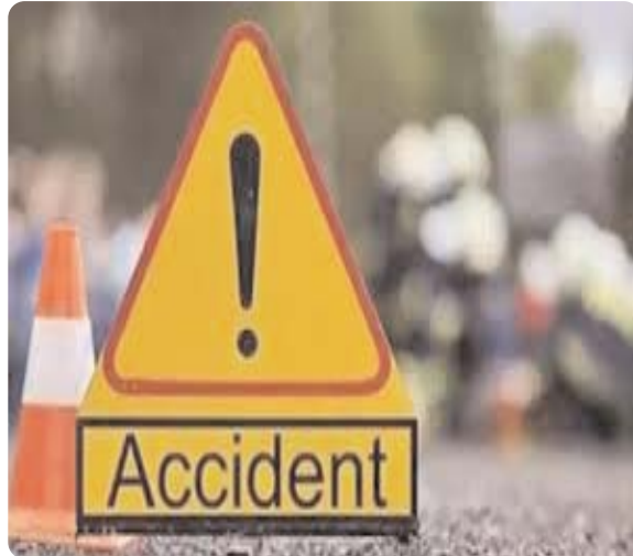
फरार बाइक चालक की तलाश कर रही है। थाना प्रभारी ने

में भर्ती कराया गया है, जहाँ उसका इलाज चल रहा है। पुलिस