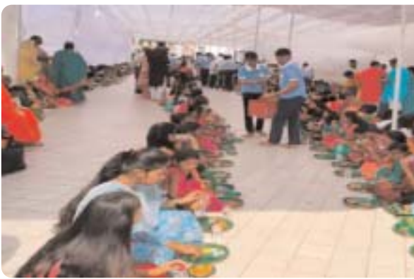
प्रशासनिक अधिकारियों और जनप्रतिनिधियों ने स्वयं कन्याओं को

नर्मदा उद्यम मंदिर परिसर में विशेष पूजा-अर्चना के साथ मां नर्मदा का जन्मोत्सव धूमधाम से मनाया गया। धार्मिक परंपराओं के अनुसार 351 कन्याओं का विशेष पूजन आयोजित किया गया, जिसमें