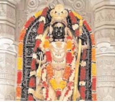
दर्शन कर सकेंगे। बता दें कि ये नई टाइमिंग 6 फरवरी से लागू होगी। अयोध्या के राम मंदिर में

सामने आई जानकारी के मुताबिक, अयोध्या के राम मंदिर में रामलला का दर्शन अब सुबह 6 बजे रात 10 बजे तक चलेगा। सुबह 4 बजे मंगला आरती की जाएगी। मंगला आरती के बाद भगवान के पट को बंद कर दिया जाएगा। इसके बाद सुबह 6 बजे श्रंगार आरती होगी और इसके साथ ही रामलला का मंदिर आम जन के लिए खोल दिया जाएगा। इसके बाद दोपहर 12 बजे रामलला को राज भोग लगेगा। भोग के पश्चात भक्त पुनः रामलला का अनवरत दर्शन कर सकेंगे। बता दें कि ये नई टाइमिंग 6 फरवरी से लागू होगी। अयोध्या के राम मंदिर में