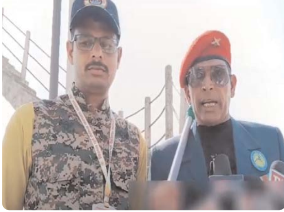
सहित समान थाने की पुलिस घंटों प्रदर्शनकारी को समझाई देने का

हालांकि इस दौरान भूतपूर्व सैनिक संगठन के तमाम पदाधिकारी