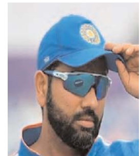
भारत- पाकिस्तान मैच...