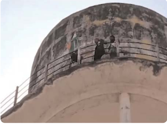
स्कूल के खिलाफ मोर्चा खोल दिया है।

मीडिया ऑडिटर, रीवा (निप्र)। रीवा सैनिक स्कूल के 72 बच्चों के निलंबन की बहाली की मांग को लेकर करीब 90 फीट ऊंची पानी की जर्जर टंकी पर एक पूर्व सैनिक चढ़ गए हैं। उन्होंने कहा कि जब तक बच्चों की बहाली नहीं होगी तब तक वह नीचे नहीं उतरेंगे। बता दें कि पांच दिन पूर्व सैनिक स्कूल प्रबंधन द्वारा कक्षा 12वीं के एक साथ निलंबित कर दिया गया था। जिसे लेकर एक भूतपूर्व सैनिक ने सैनिक