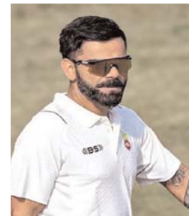
विराट कोहली की...