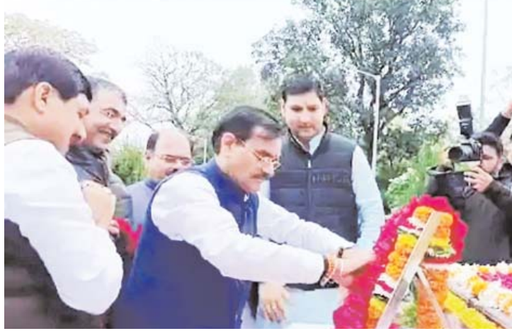
कुशाभाऊ ठाकरे परिसर पहुंचकर उन्हें श्रद्धांजलि अर्पित की। इसके बाद सभी नेताओं ने बीजेपी

मीडिया ऑडिटर, भोपाल (एजेंसी)। बीजेपी नेताओं ने शनिवार को पार्टी के पितृपुरुष कुशाभाऊ ठाकरे और सुंदरलाल पटवा की पुण्यतिथि पर मनाई। इस दौरान उन्हें स्मरण कर पार्टी को खड़ा करने के लिए उनके द्वारा किए गए योगदान का जिक्र कर उनके बताए रास्तों पर चलने की बात कही। वहीं कांग्रेस ने पूर्व प्रधानमंत्री मनमोहन सिंह के निधन पर उन्हें श्रद्धांजलि दी है।