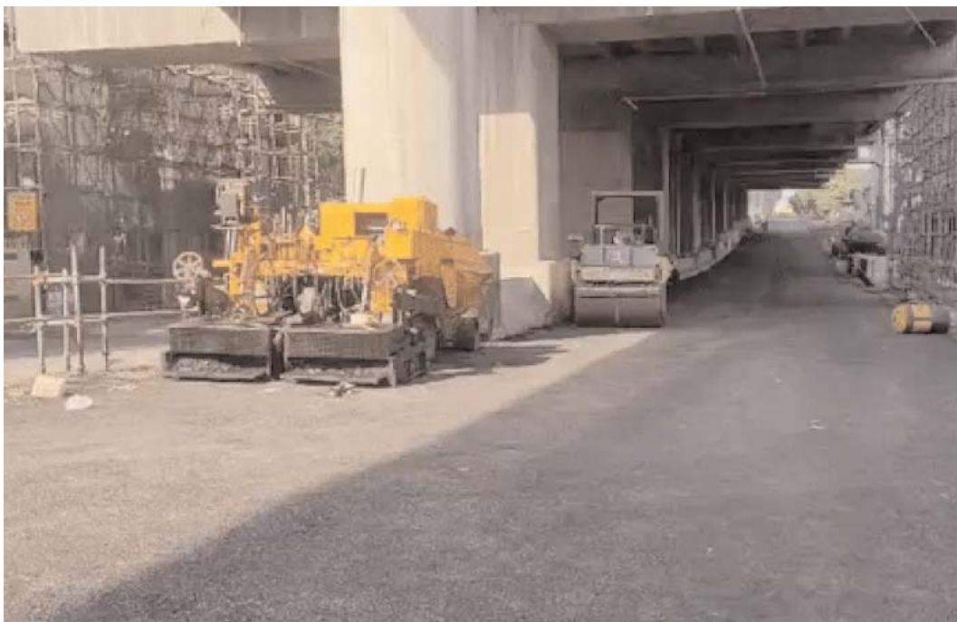
ओर आने-जाने वालों को बड़ी राहत भी सुकून महसूस कर रहे हैं, जहां से अब डीआरएम तिराहे के लेफ्ट टर्न मिली है। वहीं, उन इलाकों के लोग ट्रैफिक डायवर्ट किया गया था। मेट्रो को खोलने की तैयारी कर रहा है।

केंद्रीय स्कूल के नीचे का रास्ता सवा साल से बंद है। एक ही लेन से राहगीर एमपी नगर से सुभाषनगर की ओर आना-जाना कर रहे हैं। पीक आवर्स के दौरान जाम की स्थिति भी बन जाती है, लेकिन आने वाले दिनों में उन्हें जाम से बड़ी राहत मिल जाएगी। मेट्रो ने दूसरी लेन की सड़क भी बना दी है। करीब 8 महीने से बंद डीआरएम तिराहे की सड़क अक्टूबर में ही खोली गई है। इससे होशंगाबाद रोड से एमपी नगर की