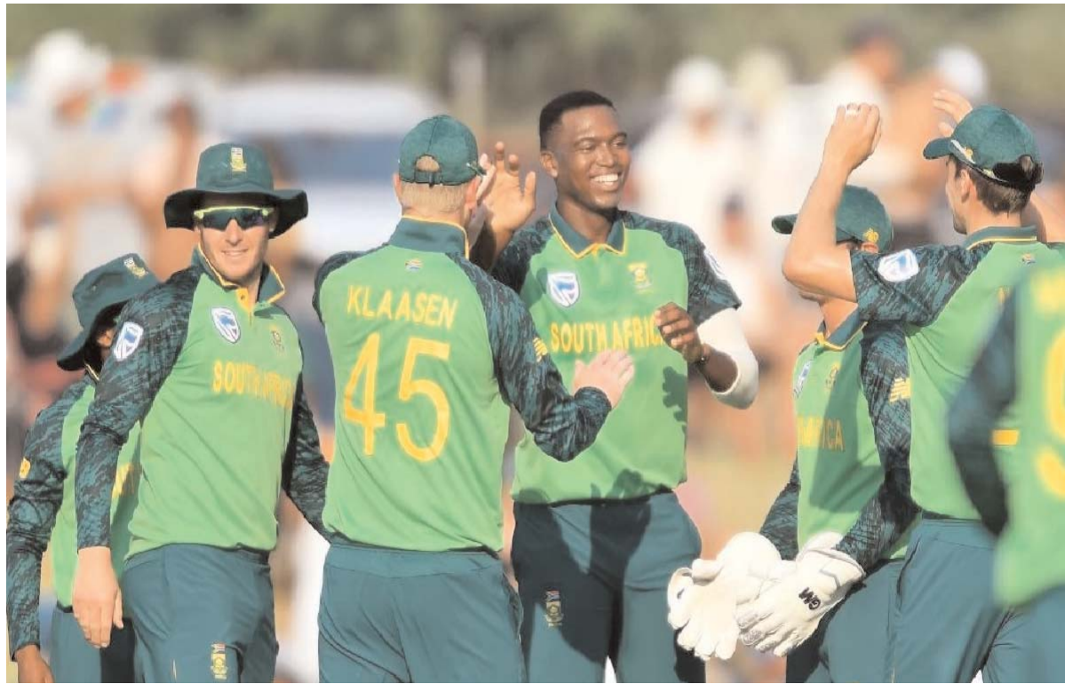
आरोपों की जांच डायरेक्टर ऑफ प्रायोरिटी क्राइम इन्वेस्टिगेशन द्वारा की

तीनों पर भ्रष्ट गतिविधियों की रोकथाम और उनका मुकाबला करने संबंधी अधिनियम 2004 की धारा 15 के तहत भ्रष्टाचार के पांच मामलों में आरोप लगाए गए हैं। धारा 15 खेल आयोजनों से संबंधित भ्रष्ट गतिविधियों से संबंधित है। तीनों पर मैचों में हेरफेर करने के लिए रिश्तत लेने या देने का आरोप है, जिससे खेल की अखंडता प्रभावित होती है।