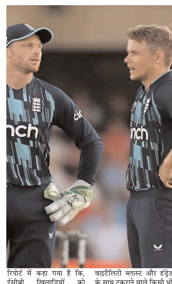
रिपोर्ट में कहा गया है कि, ईसीबी खिलाड़ियों को

द टेलीग्राफ को एक रिपोर्ट के अनुसार, इंग्लिश खिलाड़ियों को आईपीएल के अलावा पीएसएल और दुनिया की अन्य फ्रेंचाइजी लीगों में भाग लेने की अनुमति नहीं दी जाएगी। जो गर्मियों में घरेलू सीजन के साथ टकराती हैं।