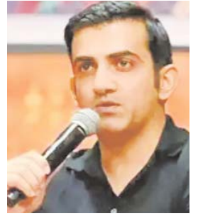
गौतम गंभीर के...