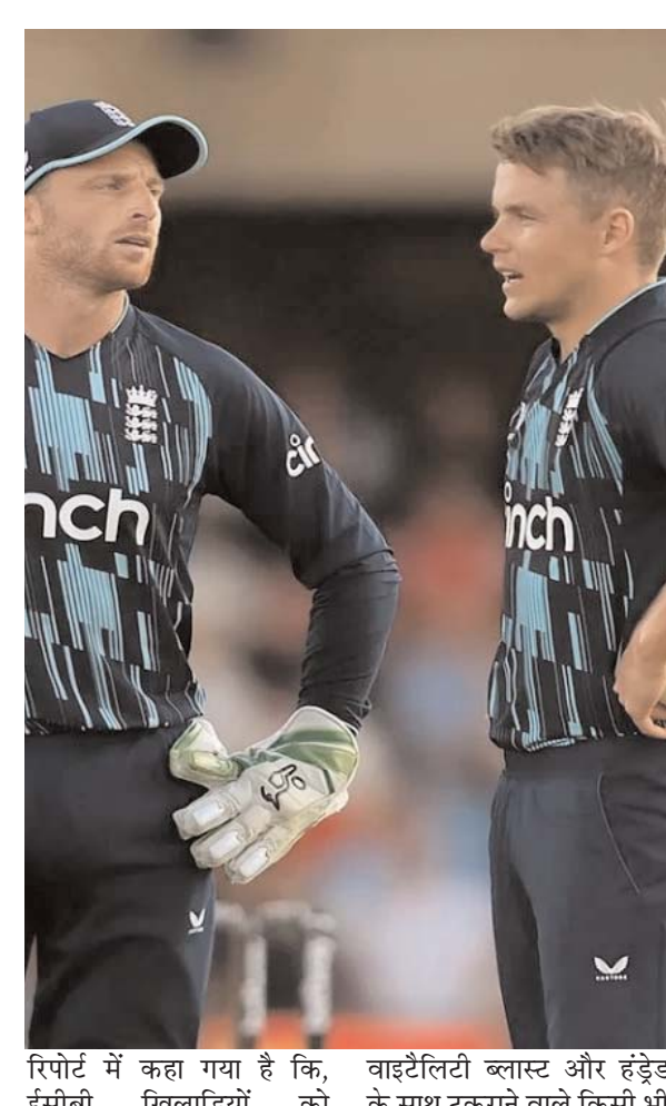
रिपोर्ट में कहा गया है कि, ईसीबी खिलाड़ियों को

द टेलीग्राफ को एक रिपोर्ट के अनुसार, इंग्लिश खिलाड़ियों को आईपीएल के अलावा पीएसएल और दुनिया की अन्य फ्रेंचाइजी लीगों में भाग लेने की अनुमति नहीं दी जाएगी। जो गर्मियों में घरेलू सीजन के साथ टकराती हैं।