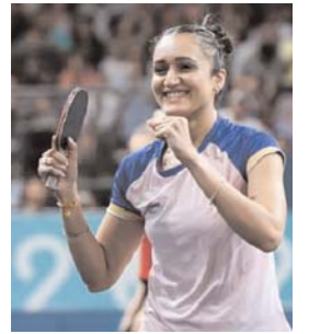
टेबल टेनिस स्टार..