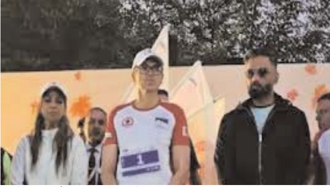
इंटरनेशनल मैराथन का आयोजन किया जा रहा है। इसमें 59 विदेशी अंतरराष्ट्रीय एथलीटों सहित 2 हजार

श्रीनगर (एजेंसी)। जम्मू एवं कश्मीर के मुख्यमंत्री उमर अब्दुल्ला ने रविवार को श्रीनगर में विशाल अंतरराष्ट्रीय मैराथन को हरी झंडी दिखाई। रविवार सुबह करीब 6.20 बजे उमर अब्दुल्ला और बॉलीवुड अभिनेता सुनील शेट्टी ने पोलो व्यू स्ट्रीट से पहली अंतरराष्ट्रीय मैराथन दौड़ को हरी झंडी दिखाई। मुख्यमंत्री उमर अब्दुल्ला ने कुछ समय तक एथलीटों के साथ दौड़ भी लगाई। इस दौरान उनके सुरक्षाकर्मी भी उनके साथ-साथ दौड़े। अधिकारियों ने बताया कि पहली बार कश्मीर में मेगा