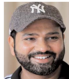
रोहित शर्मा ने ...