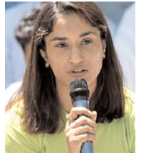
विनेश फोगाट ने...