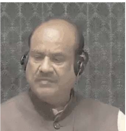
लोकसभा में नेता विपक्ष राहुल गांधी ने वायनाड त्रासदी का मुद्दा उठाया। राहुल बोले- मैं अपनी

नई दिल्ली (एजेंसी)। संसद के मानसून सत्र के 13वें दिन बुधवार को ओलंपिक से विनेश फोगाट को डिस्कालिफाइ करने का मामले खेल मंत्री ने सरकार का पक्ष रखा। लोकसभा में खेल मंत्री मनसुख मंडाविया ने कहा- विनेश को रिसलिंग के 50 किलोग्राम कटेगिरी में खेलना था। उनका वजन 50 किलोग्राम से 100 ग्राम ज्यादा पाया गया। इसलिए उन्हें अयोग्य करार दिया गया। भारत ने अंतरराष्ट्रीय कुश्ती संघ से कड़ा विरोध दर्ज किया है। भारतीय ओलंपिक संघ की अध्यक्ष पीटी ऊषा अभी पेरिस में हैं। प्रधानमंत्री ने उनसे बात करके उचित एक्शन लेने के लिए कहा है। विनेश मंगलवार 6 अगस्त को 3 मुकाबले जीतकर 50 किलोग्राम कटेगिरी की रिसलिंग के फाइनल में पहुंचने वाली पहली भारतीय महिला रिसलर बनी थीं। इससे पहले