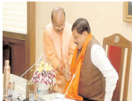
महिला और गरीब के महत्व को रेखांकित करते हुए राज्य शासन चार मिशन आरंभ कर रहा है। इस संबंध में विचार-विमर्श के

भोपाल। मुख्यमंत्री डॉ. मोहन यादव की अध्यक्षता में मंत्रि-परिषद की बैठक वंदे-मातरम् के गान के साथ आरंभ हुई। मुख्यमंत्री डॉ. यादव ने बैठक से पहले अपने संबोधन में कहा है कि मंत्रीगण अपने प्रभार के जिलों में भ्रमण के दौरान एक माह में कम से कम एक बार रात्रि विश्राम अवश्य करें। उन्होंने कहा कि मंत्रियों में अन्य धर्म की शिक्षा पर प्रतिबंध के संबंध में स्कूल शिक्षा विभाग द्वारा निर्देश जारी किए गए हैं। संविधान के अनुच्छेद 28 (3) के प्रावधान के अनुसार मद्रसों में अध्ययनरत बच्चों को उनके धर्म की शिक्षा के विपरीत अन्य धर्म की शिक्षा ग्रहण करने अथवा उपासना में उपस्थित होने को बाध्य करने वाले मद्रसों के सभी शासकीय अनुदान बंद किए जाएंगे। ऐसे मद्रसों की मान्यता समाप्त करने की विधिवत कार्यवाही सहित अन्य उपयुक्त वैधानिक कार्यवाही भी सुनिश्चित की जाएगी। मुख्यमंत्री डॉ. यादव ने कहा कि युवा, किसान,