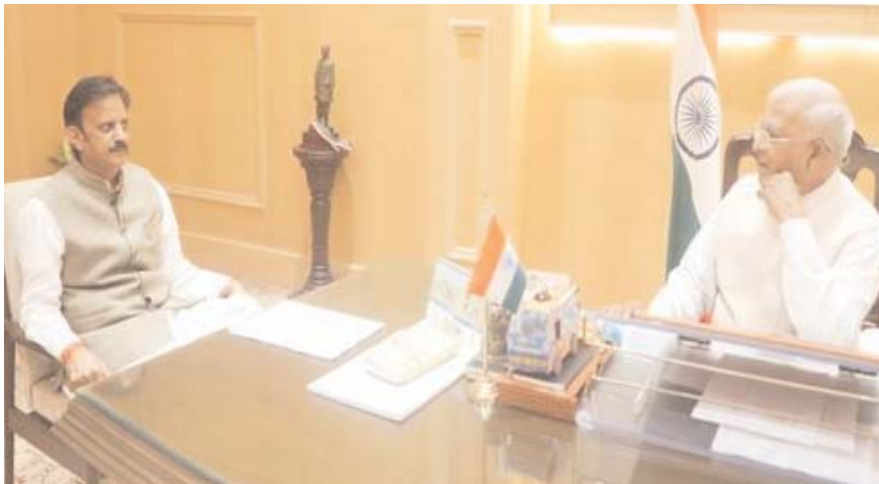
उप-मुख्यमंत्री श्री शुक्ल ने बताया कि वर्तमान में प्रदेश के 33 जिलों में सिकल सेल मरीजों

राज्यपाल श्री मंगुभाई पटेल से उप-मुख्यमंत्री श्री राजेंद्र शुक्ल ने राजभवन में सौजन्य भेंट कर सिकल सेल एनीमिया के नियंत्रण के लिए किए जा रहे प्रयासों और प्रगति से अवगत कराया। उन्होंने हीमोग्लोबिनोपैथी मिशन अन्तर्गत किए जा रहे कार्यों, सिकल सेल रोगियों एवं वल्लरबल क्षेत्र के नागरिकों के बचाव एवं उपचार के प्रयासों और संचालित जागरूकता गतिविधियों की जानकारी दी। उप-मुख्यमंत्री श्री शुक्ल ने बताया कि प्रभावित क्षेत्र का हर नागरिक सिकल सेल एनीमिया की रोकथाम के लिए सावधानियों को समझे और आत्मसात करे, इसके लिए जागरूकता और आउटकम की मॉनिटरिंग के प्रयास किए जा रहे हैं, इन प्रयासों से सिकल सेल एनीमिया को जड़ से समाप्त किया जायेगा।