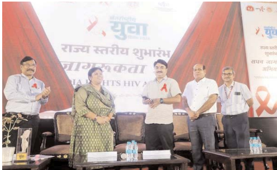
स्थिति में जल्दी से जल्दी अपना एआरटी उपचार शुरू करना। इन तीन बिंदुओं पर सभी लोगों को

मीडिया ऑडिटर, भोपाल (एजेसी)। उप-मुख्यमंत्री श्री राजेंद्र शुक्ल ने कहा है कि प्रिवेंशन इज बेटर दैन क्योर यदि हम अपने स्वास्थ्य के प्रति और स्वस्थ जीवनशैली के प्रति जागरूक रहेंगे, नियमित जाँच करावेंगे तो हम बीमारी के दुष्प्रकार से बाहर रहेंगे। स्वास्थ्य के प्रति जागरूक रहना और खतरों के प्रति सचेत रहना महत्वपूर्ण है। उप-मुख्यमंत्री श्री शुक्ल ने वीडियो संदेश के माध्यम से सभी नागरिकों से प्रदेशव्यापी इंडिया फाइट्स एचआईवी एंड एसटीआई अभियान में सहभागिता की अपील की। उप-मुख्यमंत्री श्री शुक्ल ने कहा कि एड्स के संक्रमण के कारण, बचाव एवं उपचार के प्रति नागरिकों और युवाओं की जागरूकता इसके नियंत्रण के लिए आवश्यक है। लापरवाही से यह गंभीर बीमारी जानलेवा भी साबित हो सकती है। उप-मुख्यमंत्री ने कहा कि एचआईवी-एड्स के बारे में सही जानकारी की प्राप्ति करना, जागरूक व्यवहार पर एचआईवी की जाँच कराना और एचआईवी-पॉजिटिव की