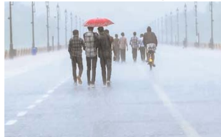
संभावना है। कोंकण और गोवा, मध्य महाराष्ट्र, मराठवाड़ा, कर्नाटक, केरल और माहे और लक्षद्वीप में गरज, बिजली और तेज हवाओं (40-50 किमी प्रति घंटे) के साथ व्यापक रूप से हल्की से मध्यम वर्षा होने की संभावना है।

नई दिल्ली (एजेंसी)। भारत मौसम विज्ञान विभाग ने शनिवार को कहा कि दक्षिण-पश्चिम मानसून मध्य अंबर सागर, दक्षिण महाराष्ट्र, तेलंगाना और दक्षिण छत्तीसगढ़ और दक्षिण ओडिशा के कुछ हिस्सों के साथ-साथ तटीय आंध्र प्रदेश के अतिरिक्त क्षेत्रों में आगे बढ़ गया है। मौसम पूर्वानुमान एजेंसी ने अगले 2-3 दिनों में मध्य अरब सागर के शेष हिस्सों और मुंबई और तेलंगाना सहित महाराष्ट्र के अतिरिक्त क्षेत्रों में मानसून के आगे बढ़ने के लिए अनुकूल परिस्थितियों की सूचना दी है। अगले पांच दिनों में पूरे महाराष्ट्र और तटीय और उत्तरी आंतरिक कर्नाटक में भारी से बहुत भारी वर्षा होने की संभावना है। महाराष्ट्र में 8 से 11 जून तक और कर्नाटक में 8 और 9 जून को अत्यधिक भारी वर्षा होने की