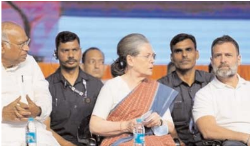
नैतिक हार भी है। प्रस्ताव में आगे कहा गया, "कांग्रेस को पुनरुत्थान के मार्ग पर मजबूती से लाने के लिए कार्य समिति देश के लोगों को धन्यवाद देती है। कांग्रेस के नेता और कार्यकर्ता मजबूती से उठे रहें।

नई दिल्ली (एजेंसी)। कांग्रेस कार्य समिति (सीडब्ल्यूसी) ने लोकसभा चुनाव में पार्टी के अच्छे प्रदर्शन के लिए पार्टी नेतृत्व की सराहना करते हुए प्रस्ताव पारित किया और कहा कि अध्यक्ष मल्लिकार्जुन खरगे, पूर्व अध्यक्ष सोनिया गांधी, राहुल गांधी तथा महासचिव प्रियंका गांधी वाद्रा ने इस चुनाव में जोरदार प्रचार अभियान की अगुवाई की। कार्य समिति ने देश के लोगों का आभार जताते हुए कहा कि जनता ने कांग्रेस में नई जान फूंक दी है और पार्टी अब पुनरुत्थान का मार्ग पर मजबूती से आगे बढ़ रही है। कार्य समिति द्वारा पारित प्रस्ताव में कहा गया है, "देश की जनता ने पिछले एक दशक के शासन की प्रकृति और शैली दोनों को निर्णायक रूप से नकार दिया है। लोकसभा चुनाव का ये जनदेश न केवल प्रधानमंत्री की राजनीतिक हार है, बल्कि उनकी